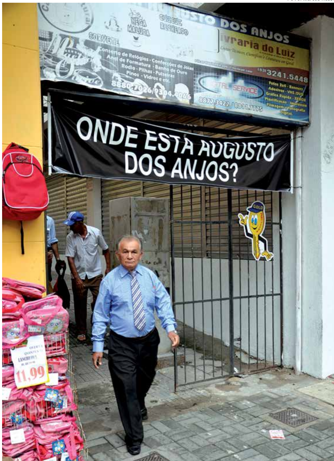
Na entrada da galeria foi afixada a faixa "Onde está Augusto dos Anjos?" para alertar autoridades