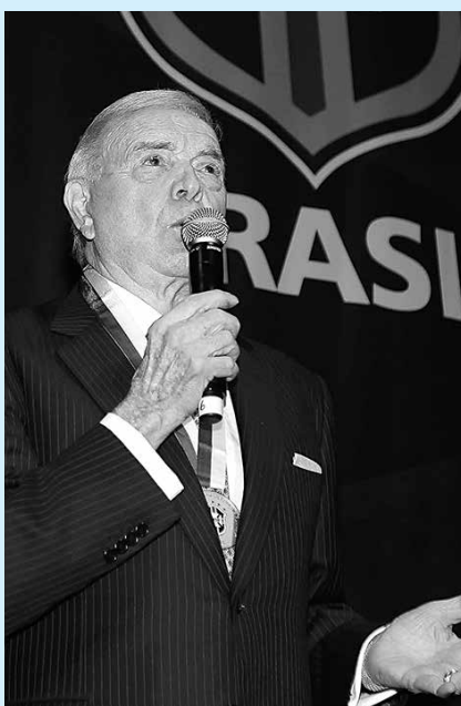
O presidente Marin em situação difícil

A assessoria da CBF divulgou que todas as liminares obtidas em São Paulo alterando as decisões da Justiça Desportiva foram cassadas e, com isso, a tabela foi anunciada. A competição começará no dia 20 de abril, e a paralisação para a Copa do Mundo irá do dia 1 de junho a 20 de julho.