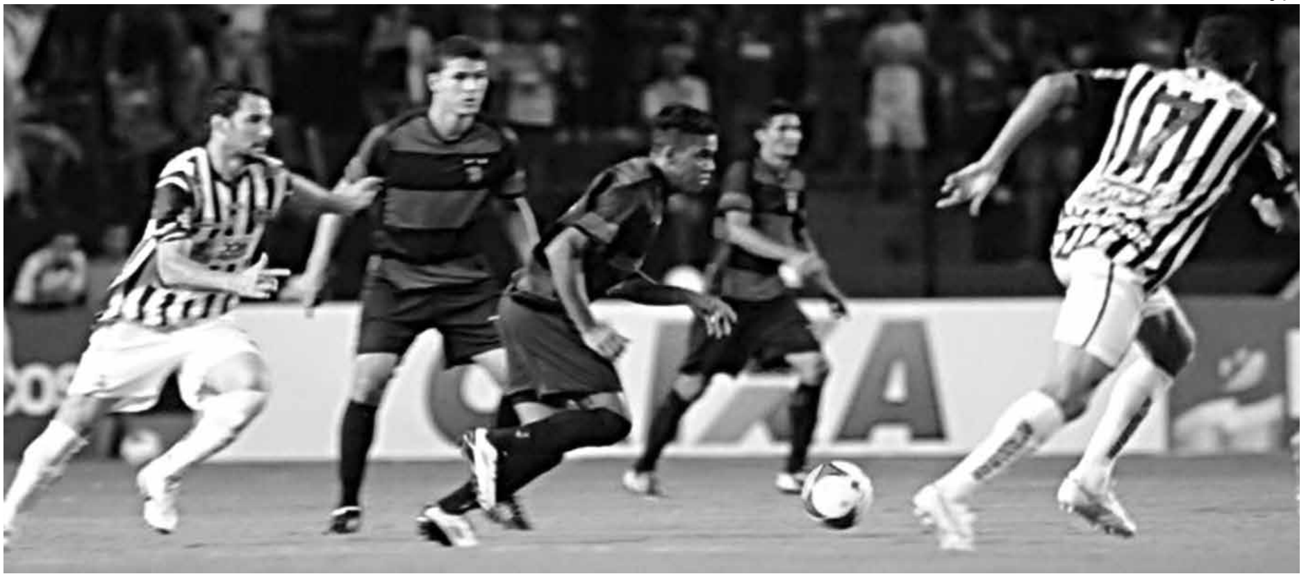
O Botafogo fez grandes atuações pela Copa do Nordeste, mas não conseguiu a classificação para a segunda fase. A derrota para o Sport em Recife selou a eliminação

O Botafogo estreou bem na Copa do Brasil, ao empatar em zero a zero com a forte equipe do Vitória de Santo Antão, em partida disputada na última quinta-feira, no Estádio José Cavalcante, em Patos. Com este resultado, o Botafogo conseguiu adiar a decisão da vaga para a próxima fase da Copa do Brasil. Será no próximo domingo, às 16h, no Estádio Severino Carneiro (O Carneirão), em Vitória de Santo Antão-PE, quando apenas uma das equipes seguirá na compe-