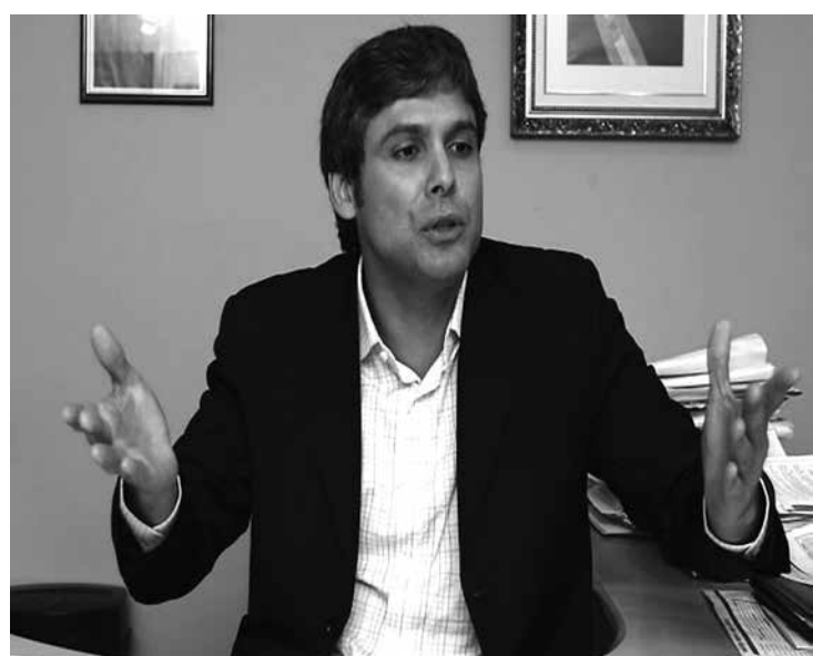
Lindberg escapa de acusações feitas pelo Ministério Público do Rio

Os ministros do STF concordaram com os argumentos apresentados pelo procurador e entenderam que a denúncia do Ministério Público não justificou a importância das informa-