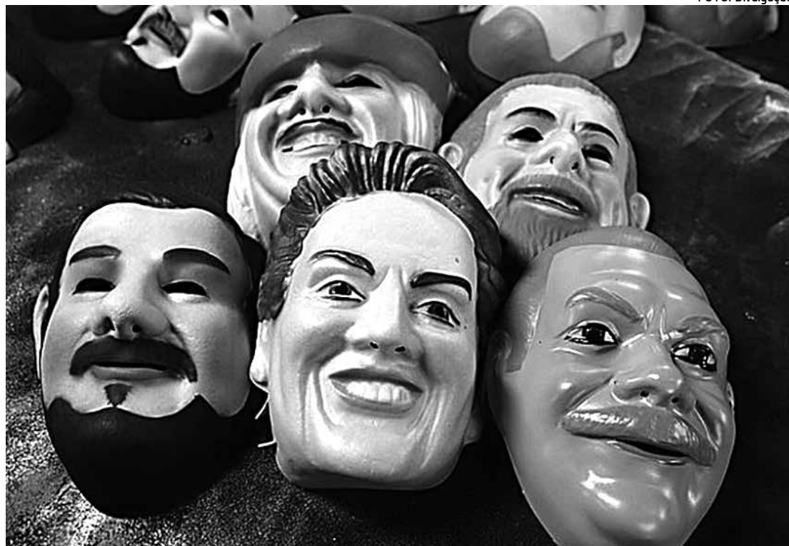
Máscara da presidente Dilma Rousseff é a mais procurada neste período que antecede o Carnaval

E para quem deseja um outro modelo do produto, mais flexível e que se adequa ao rosto, deve desembolsar R$ 4,99. Novidade nas vendas são as máscaras de personalidades políticas, como por exemplo, a da presidente da República, Dilma Rousseff, e do deputado federal Francisco Everardo Oliveira da Silva, conhecido popularmente como Tiririca.