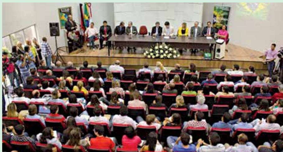
Operadores do direito lotam auditório da OAB para debater sobre Reforma Política

Nas suas palestras, Randolfe destacou que a única e verdadeira reforma política possível no Brasil é a proposta pela OAB, através da Ação Direta de Inconstitucionalidade (ADI), que o propõe o fim do financiamento de campanhas políticas por empresas privadas. Ele acrescentou que a “minirreforma eleitoral aprovada no Congresso