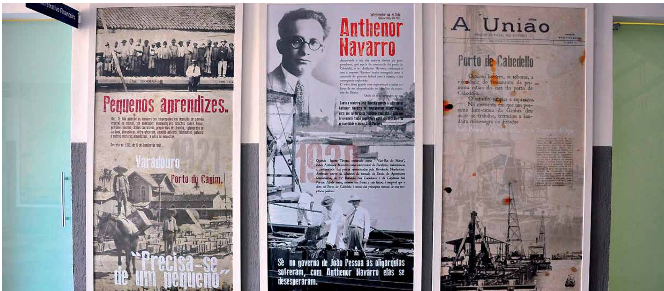
Exposição com 50 painéis resgata as diversas fases do Porto de Cabedelo ao longo de oito décadas de história PÁGINA 3