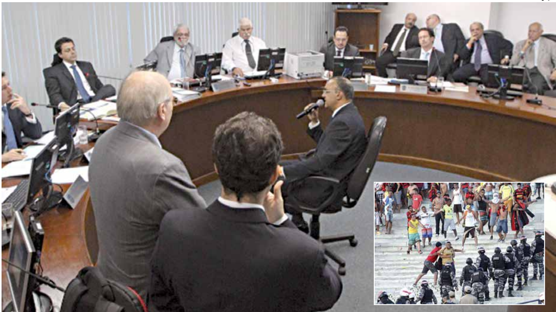
Imagem da reunião do STJD que puniu o Lusa com a perda de 4 pontos no Brasileiro e, no detalhe, a confusão armada pela torcida do Sport que prejudicou o Bota-PB

A Justiça Comum também deu ganho de causa ao Sousa Esporte Clube na Copa do Brasil do ano passado. A vaga, preliminarmente, seria do Centro Sportivo Paraibano, no entanto, o time sertanejo foi ao STJD questionando a legalidade do “tigre”. O recurso foi acolhido, mas, o CSP ganhou uma liminar na Justiça Comum para segurar a vaga, o que, levou o Sousa a recorrer aos tribunais e cassar a liminar. O “dinossauro” jogou contra o Coritiba e foi desclassificado no primeiro jogo (3 a 0).