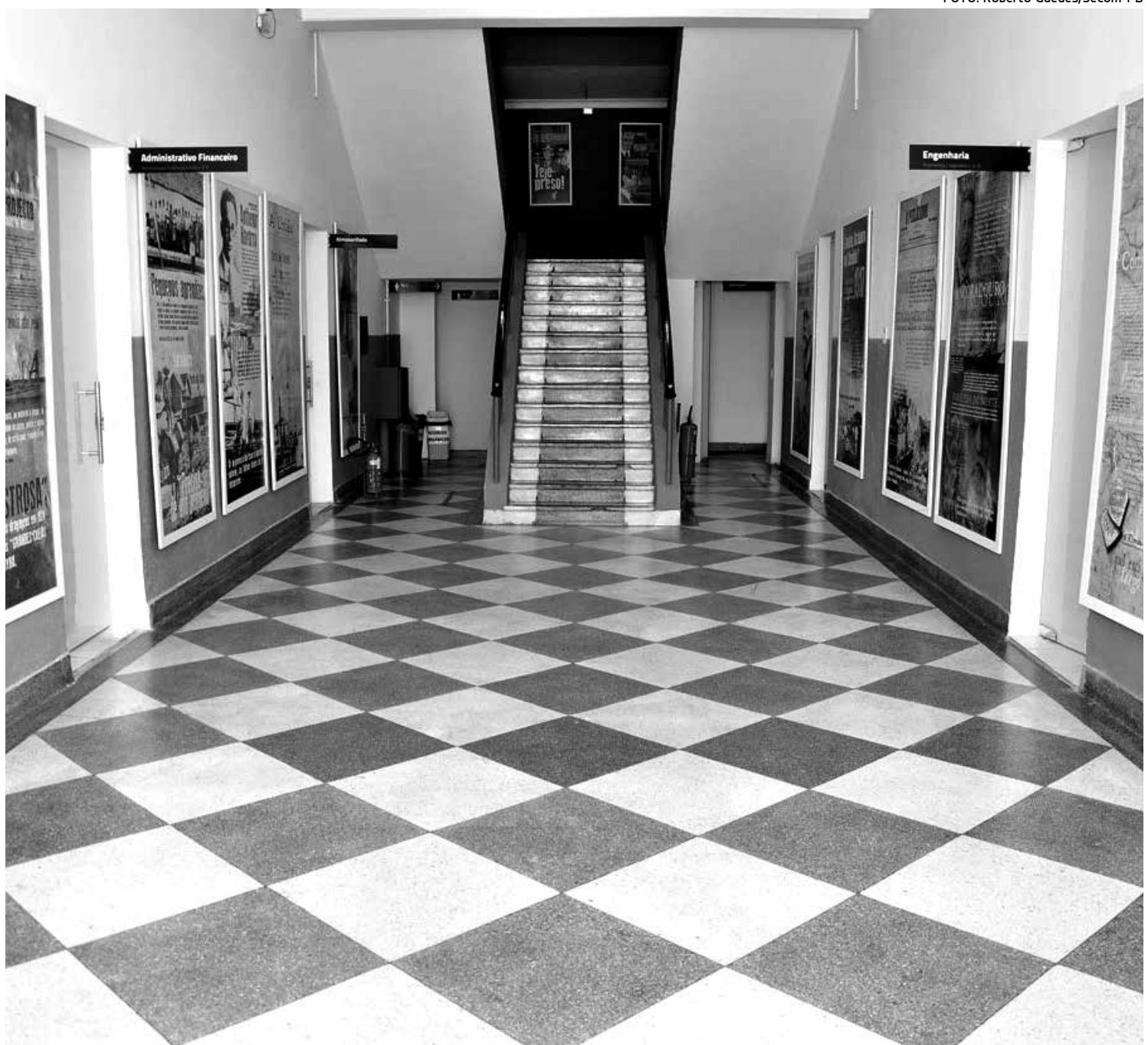
A exposição permanente sobre o Porto de Cabedelo, idealizada pela Companhia Docas, possui painéis com capas de edições de A União

No ano de 1864, o engenheiro André Rebouças apresentou projeto de um atracadouro internacional que teria um potencial melhor do que o Porto do Capim e seria ideal para se livrar da alfanega de Pernambuco. Wilbur acrescenta que a exposição permanente será aberta oficialmente por ocasião da inauguração das obras de reforma do porto. A pesquisa poderá gerar a publicação de um livro sobre a história do porto de Cabedelo.