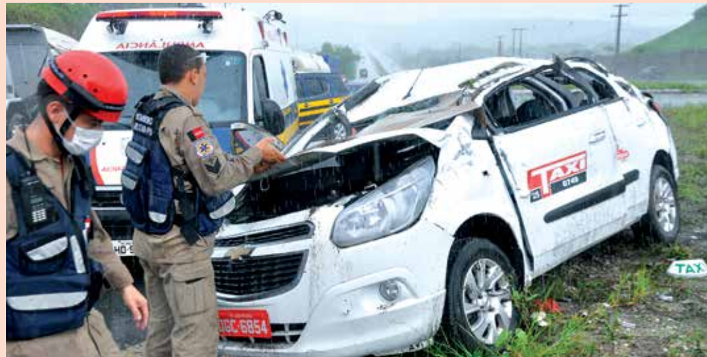
O carro ficou totalmente destruído e o taxista foi socorrido para o Hospital de Trauma

Na operação, além da fiscalização normal de trânsito, o foco principal da PRF foi detectar possíveis irregularidades nos veículos que fazem transportes de cargas perigosas e de outros que trafegam com peso e cargas excedentes. A finalidade é alinhar todas as Polícias Federais para a Copa do Mundo, que acontece no mês de junho.